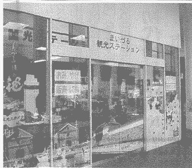
設置されたまいづる観光ステーション(舞鶴市伊佐津)